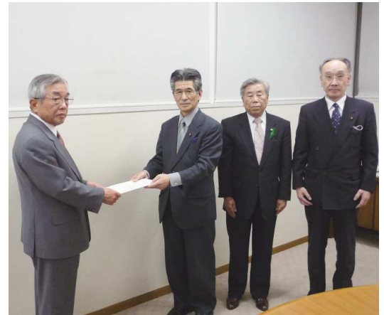
市長に特別委員会の調査研究結果報告書を手渡す中根前議長

これを受けて、5月臨時会へ条例(案)を議員提出議案として上程し、全会一致で可決、制定しました。