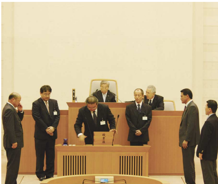
議長選挙の様相(市役所南庁舎 本会議場)