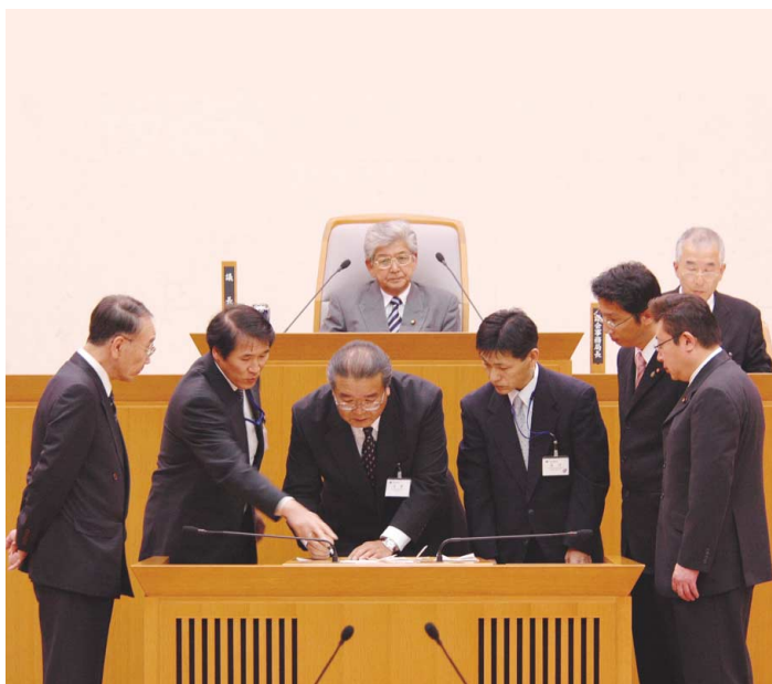
議長選挙の様相(市役所南庁舎 本会議場)