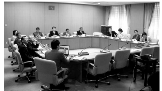
初当選議員への研修会の模様

本市議会では、新たに当選した議員を対象にして、4月24日を皮切りに計7回の研修会を実施。議会事務局職員や関係部局の職員が講師となり、議会運営に関することや本市の行政機構、施政方針や当初予算と主要事業などについて詳しく解説を受けました。初当選議員は、今後の活動に必要な知識を修得し、より良い市政の実現に向けて着実な一歩を踏み出しました。