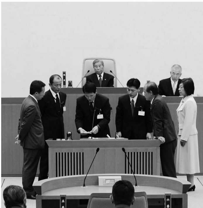
議長選挙の様相(市役所南庁舎 本会議場)