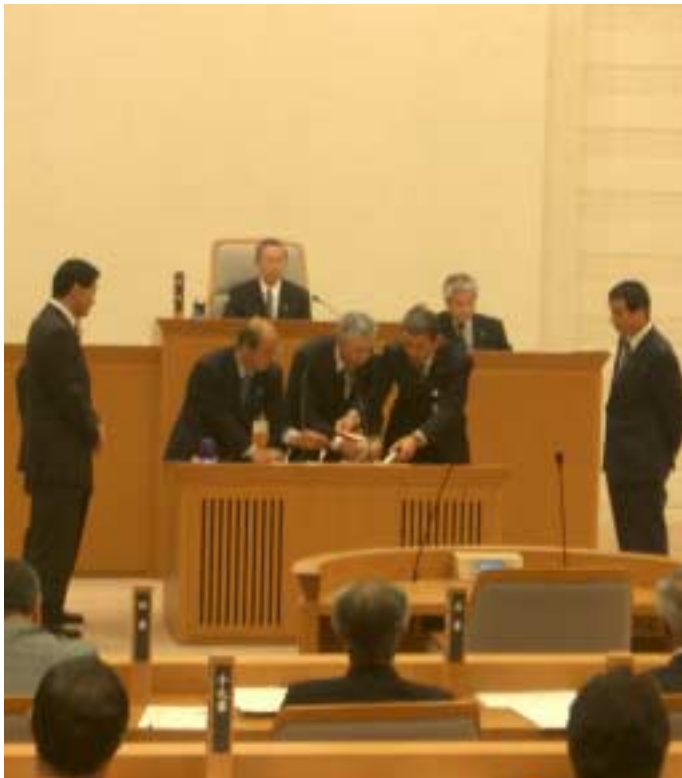
議長選挙の様相 市役所南庁舎本会議場