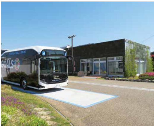
■とよたエコフルタウンの様子

令和元年度は、豊田市に他自治体の議会から80団体、688名の皆様が視察に訪れました。視察項目としては、豊田市低炭素社会モデル地区(とよたエコフルタウン)、交通まちづくりが多く、豊田市の先進的なまちづくりへの関心の高さが表れています。