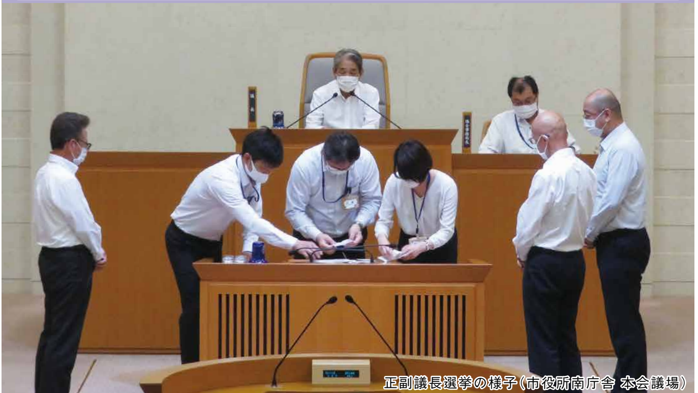
正副議長選挙の様子(市役所南庁舎 本会議場)