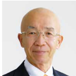
山口 光岳 副議長