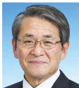
深津 眞一 副議長