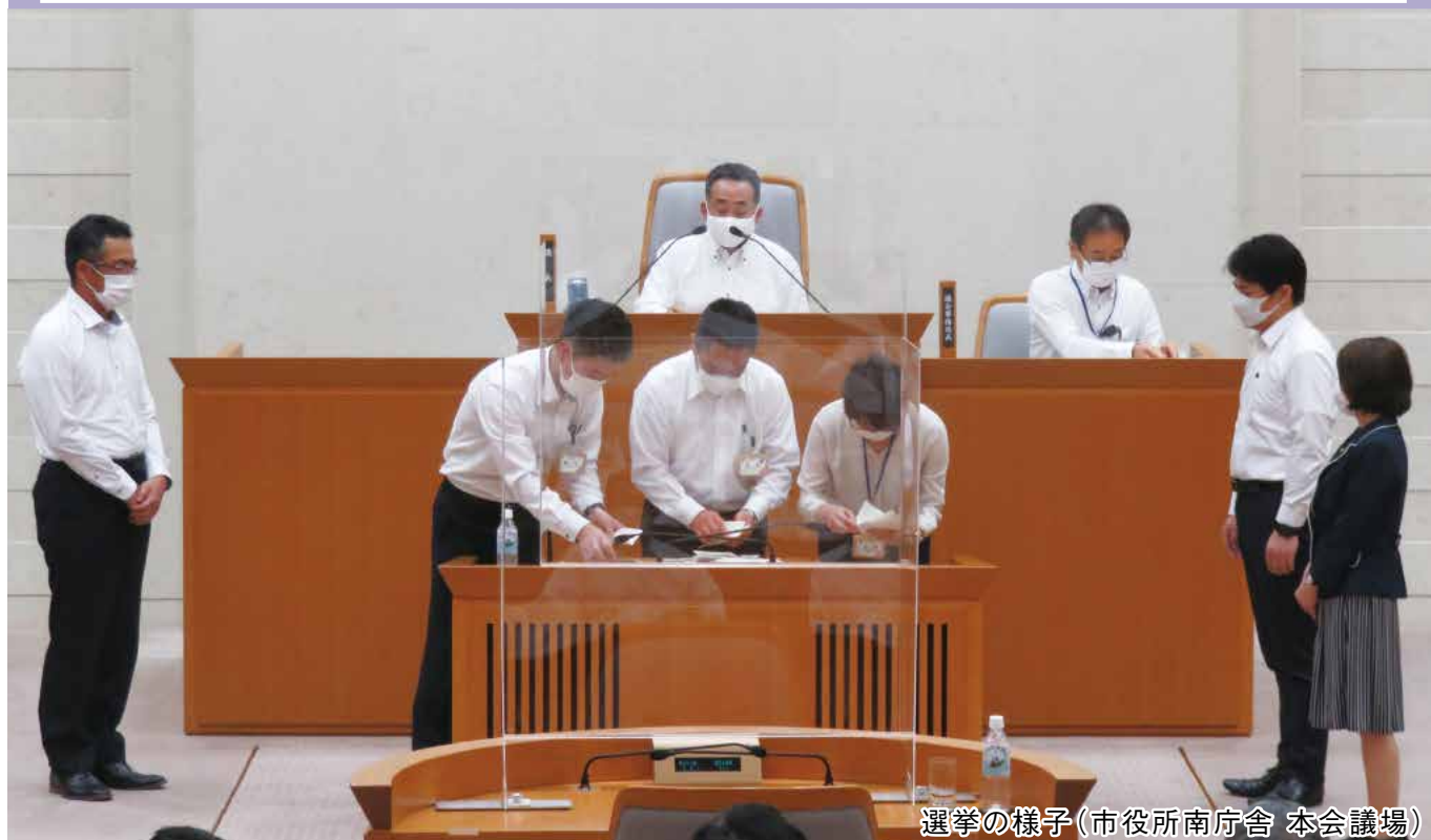
選挙の様子(市役所南庁舎 本会議場)