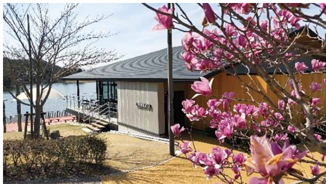
鞍ヶ池公園の様子