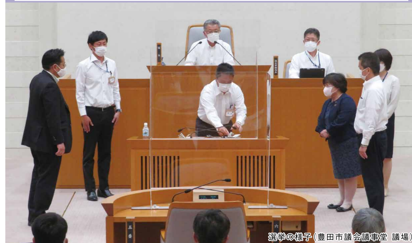
選挙の様子(豊田市議会議事堂 議場)