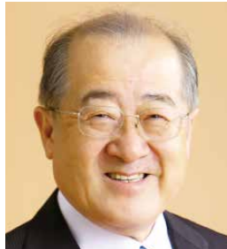
副議長 窪谷 文克