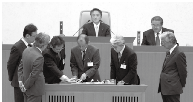
▲議長選挙の様相(市役所南庁舎 本会議場)