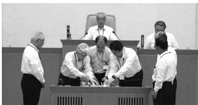
▲議長選挙の様様(市役所南庁舎 本会議場)