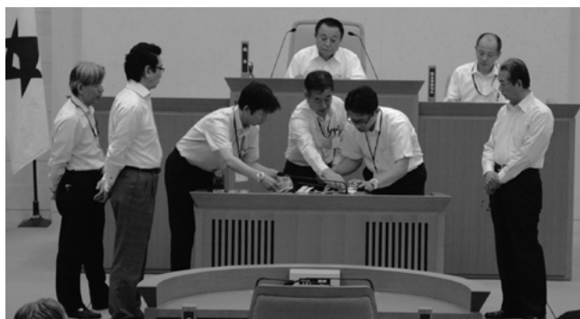
▲議長選挙の様相(市役所南庁舎 本会議場)