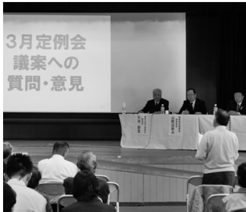
■高橋会場での様子