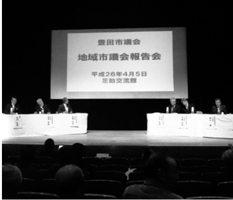
■足助会場での様子