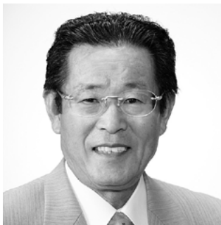
都 築 議 長