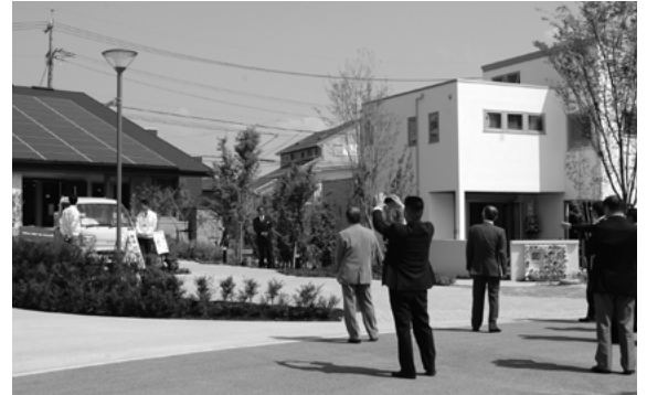
■スマートハウスエリア