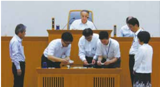
▲議長選挙の様相(市役所南庁舎 本会議場)

議長 かみ 神 や 谷 かず 和 とし 利 副議長 ひ 日 え 惠 の 野 まさ 雅 とし 俊