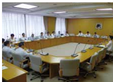
▲初当選議員への研修会の様子

本市議会では、新たに当選した議員を対象に、4月28日を皮切りに計7回の研修を実施。議会事務局職員や関係部局の職員から、議会運営に関することや、本市の行政機構、施政方針や当初予算と主要事業などについて解説を受けました。初当選議員は、これらの研修を通じて、議員活動に必要な知識を修得し、より良い市政の実現に向けて着実な一歩を踏み出しました。