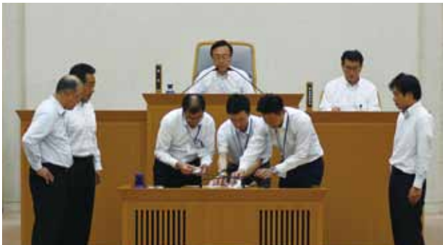
▲議長選挙の様相(市役所南庁舎 本会議場)