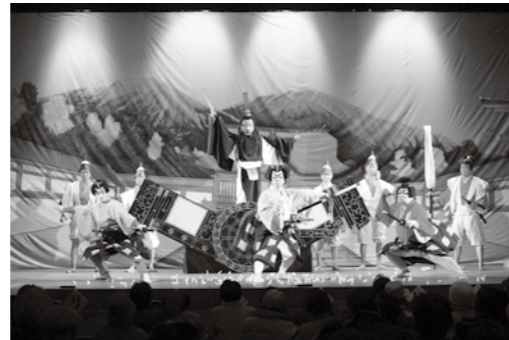
小原歌舞伎 五月(さつき)公演の様子

内容 小原交流館の研修室の一つを廃止し、(仮称)豊田市小原歌舞伎伝承館を整備することで普及啓発や活動支援を行います。 小原歌舞伎(豊田市無形民俗文化財)は、江戸時代中期から、神社に奉納する地芝居として始まり、いにしえからの技と伝統が今も脈々と受け継がれています。