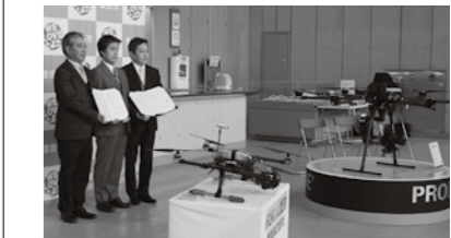
ミライ・チャレンジ都市パートナーシップ協定

ドローンの普及を新たなビジネスや社会の課題解決につなげることを目的に、平成27年度ミライ・チャレンジセミナーとして、市民や企業を対象とした講演会とデモ飛行を実施した。ミライ・チャレンジ都市パートナーシップ協定により、市のドローン活用に関してパートナー企業から機体やオペレーターの提供、人材育成等の協力を得る体制を構築した。現在、市業務での具体的なドローン活用方法を整理し、災害時の現場確認、緊急物資の運搬、消火活動の支援、広報用写真の撮影、公園・河川・橋梁の管理などを想定し迅速に対応できる体制を整えていく。