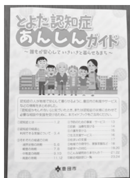
とよた認知症あんしんガイド

とよた認知症あんしんガイドは、市役所・地域包括支援センター・医療機関で配布しているが、より多くの人に手軽に活用していただくためにホームページへの掲載も有効だと考える。とよた認知症あんしんガイドの内容に加え、認知症のきざしが簡易に確認することができる項目など、関心を持ってもらえる情報をとりまとめ、平成28年度中に配信をしていく予定である。