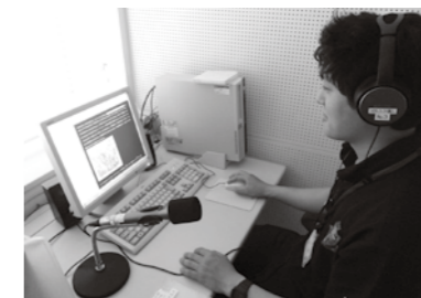
マルチメディア・デジジー図書

発達障がいの方の、障がい者用資料の現行の貸し出し条件は、医療機関等に通院又は入院する方は、障がいの程度を提示する必要がある。ディスレクシアの場合、医療機関等に通っていない場合もあり、障がいの程度の証明が困難である。ディスレクシアのように、読み書きに困難を抱える障がい者に加えて、高齢者の方々にもマルチメディア・デジジー図書を含むデジジー図書を活用してもらいたいと考え、今後貸し出し条件等の緩和を図っていききたい。