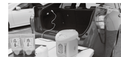
ハイブリッド車からの外部給電の様子

答弁 補助金の活用については、5市のうち、豊田市と岡崎市、みよし市の3市が次世代自動車の普及促進を共通テーマに応募し、いずれも採択されており、安城市と知立市は今回応募していない。ただ、事業実施の段階では安城市、知立市も含め、連携して行う予定をしている。