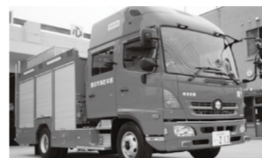
水槽付きポンプ自動車

答弁 国が示す、消防力の整備指針の改正内容は、大規模な地震災害時で活用する非常用車両の台数を増加させるもので、この改正により、本市では、平常時で活用する台数は満たしているが、非常用の消防ポンプ自動車2台と、同じく非常用の救急自動車1台が不足する状況となっている。不足している車両については、次期消防整備基本計画で、新規購入として盛り込み、消防力の整備指針に定められた台数になるよう整備していく考えである。