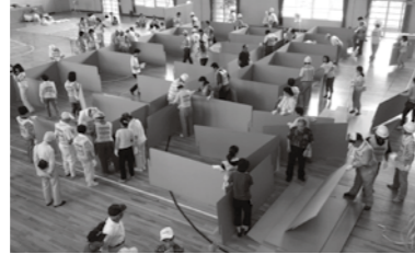
段ボール間仕切りを使用した防災訓練

イバシーに配慮した避難スペースを確保するため、段ボール間仕切りを地区防災倉庫等に分散して備蓄し、居住スペースの仕切りとして利用するほか、個室タイプの間仕切りも備蓄し、活用ができると考えている。