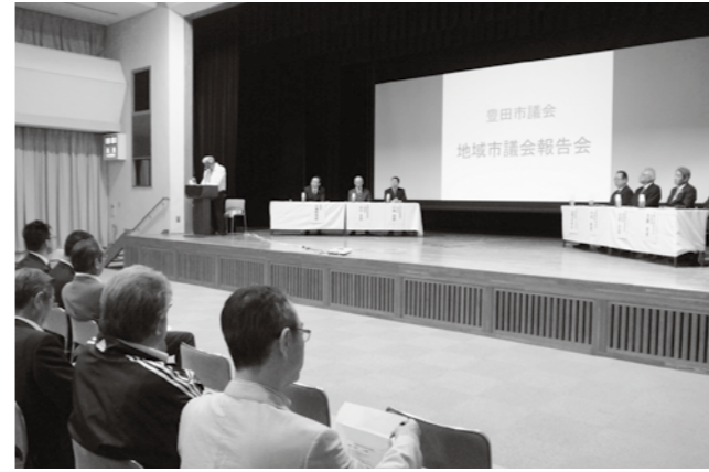
▲地域市議会報告会の様子

定 例会が年4回の開催ということは、議員は残りの期間、何をしているのか疑問になった方もみえると思います。議員は、議会が開かれていない間でも、市民に議会で話し合った内容を紹介する地域市議会報告会の開催や、市民の意見も交えたシンポジウムを開催しています。さらに、特別委員会という調査研究グループもあり、現在、豊田市において課題となっている項目を調査研究し、市長への政策提言を行っています。