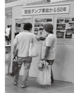
とよた 安全安心 フェスタ パネル展示

今年度、猿投台地域会議から要請を受け、12月に猿投台中学校で交通安全シンポジウムを開催する。シンポジウムでは、「猿投台地区から発信！交通死亡事故ゼロのまち豊田市を目指して」をテーマに、スライド上映や各世代の代表者によるパネルディスカッションのほか、中学生を対象とした交通安全ワークショップ、猿投台地区の資料展示等を実施予定である。猿投台地区は、我が国の交通事故史に残る衝撃的な事故であり、このシンポジウムを通じて、交通死亡事故根絶への決意をメッセージとして、猿投台地区から広く市内外へ発信していきたい。