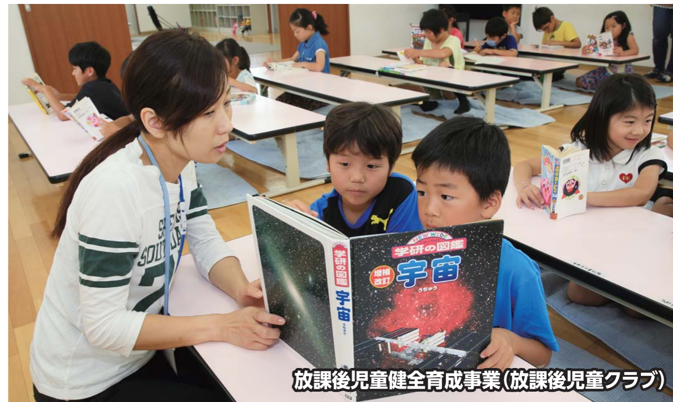
放課後児童健全育成事業(放課後児童クラブ)

豊田市では、保護者が就労や病気等の理由により昼間家庭にいない小学校に通う児童(原則、小学1年生～小学4年生)に対して、児童の健全な育成を図ることを目的として、授業の終了した放課後等に遊び時間や生活の場を提供しています。写真はその放課後児童健全育成事業(放課後児童クラブ)の様子です。