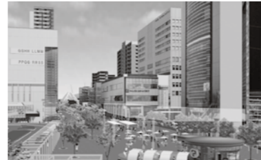
豊田市駅 東口 イメージ図

今年3月策定の都心環境計画と、6月策定の矢作川河川環境活性化プランがあり、都心環境計画では、都心空間の活用と再整備の両面から施策を推進する。活用の取組では、テナントミックス事業など民間事業の推進、中央図書館、コンサートホール、美術館などの公共施設の利用促進と公共空間の活用推進などを連携して展開し、再整備の取組では、名鉄豊田市駅を中心に本市の顔づくり、主要施設の再整備を進める。矢作川河川環境活性化プランでは、多くの市民が利用する空間を創出し、河川空間の新たな活用を推進していく。